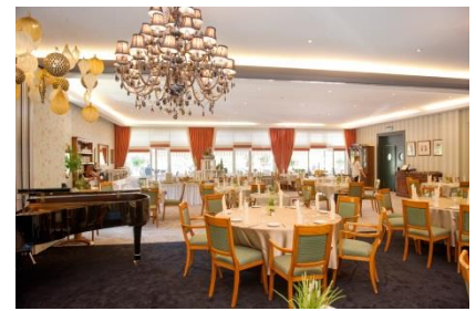
Les Terrasses Fleuries