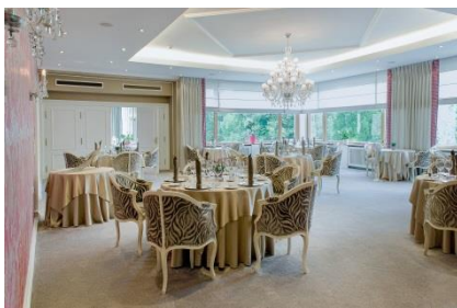
La Vie en Rose